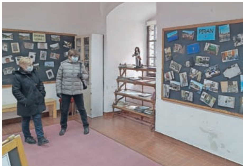
Na razstavi Tisočletne sledi v mestu

Na šolskem tekmovanju iz računalništva Bober je sodelovalo 84 učencev od 4. do 9. razreda. Bronasta priznanja je prejelo 26 učencev. Učenka 9. razreda Tjaša Demšar se je uvrstila na državno tek-