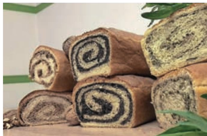
Potice s Kmetije Pr' Režen

Vsi pekovski izdelki so izdelani ročno, po tradicionalnih receptih brez dodatkov in vsebujejo le najboljše sestavine. Ponujajo maslene piškote, orehove rogljičke, smetanove palčke, linške piškote, janeževe upognjence in piškote iz pire. Poleg piškotov ponujajo tudi krhke flancate, različne vrste kruha in domače rezance. Izdelke, ki jih trenutno prodajajo po vsej Sloveniji, je možno ob predhodnem dogovoru prevzeti tudi na kmetiji na Gorenjem Brdu. Na teden v krušni peči spečejo več kot dvesto kilogramov kruha različnih vrst. Kruh pripravljajo iz bele, polbele, polnozrnate, ržene in pirine moke. In prav kruh je eden izmed najbolj prodajnih izdelkov. "Stranke imajo rade polbeli kruh iz krušne peči, med piškoti oziroma pecivi pa piškote brez moke. Ponudba izdelkov je vse leto stalna." Trudijo se, da so njihovi izdelki v prvi vrsti kakovostni in izdelani iz sestavin, pridelanih v Sloveniji. Za pripravo ovirkovke denimo uporabljajo domače ocvirke kmetije Žunar. "V delo sta me vpeljala oče in mama,"