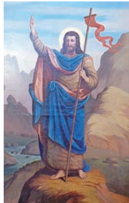
Slika po restavratorskem posegu

Šubic. Kot zanimivost velja omeniti, da je Wolf pomanjšano kopijo gorenjevaške slike naredil še za stranski oltar cerkve v Šentvidu nad Ljubljano.