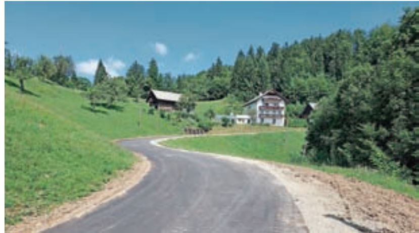
Obnovljeni odsek ceste proti Hlavčim Njivam

Ob praznovanju dneva državnosti v organizaciji KS Gorenja vas je bila namenu izročena Fortunova brv čez reko Soro. Pomembna pridobitev preteklega leta je tudi novoletna okrasitev Gorenje vasi, ki je bila izvedena v sklopu občinskega projekta osvetlitve. Zbornik Gorenjevaško in Hotaveljsko skozi čas – Bogastvo preteklosti za izzive prihodnosti je zgodba o naših krajih in