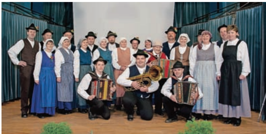
Folklorna skupina Sovodenj letos praznuje štirideset let neprekinjenega delovanja.