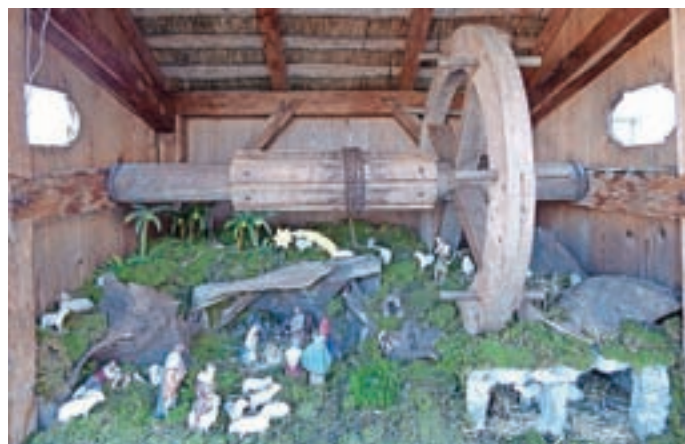
Jaslice v zgornjem delu Hotavelj