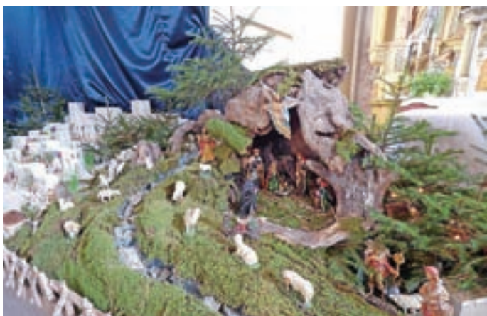
Jaslice na Trati