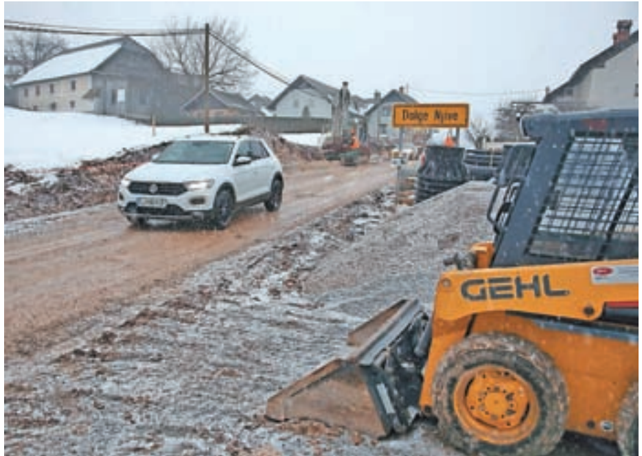
Obnovo ta čas nadaljujejo na odseku od naselja Dolge Njive proti Suhemu Dolu.

V sklopu del, ki bodo potekala ob polovični zapori ceste, bodo na odseku od naselja Dolge Njive proti Suhemu Dolu zmanjšali ovinke, pri čemer bodo pri največjih sedanjih ovinkih poskrbeli za prestavitev celotne trase ceste z novimi useki v teren, sedanjo traso pa bodo zasuli, je pojasnil Kržišnik in dodal, da bo treba zgraditi tudi nekaj opornih zidov, predvsem pod cesto. Popolne zapore ceste med izvedbo del niso predvidene, bo pa predvidoma