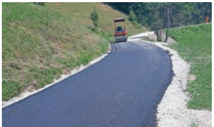
Obnovljena cesta Grapa–Podčrtar–Stata

Poleg rednega letnega vzdrževanja lokalnih cest in javnih poti so bili na novo z asfaltno prevleko urejeni 200-metrski odsek JP Grapa–Podčrtar–Stata, 50-metrski odsek JP Žunar–Stotnkar in 40-metrski odsek JP Hobovše–Travnik do krajevne meje s KS Trebija. Poleg tega so bili pokrpani še nekateri krajši odseki.