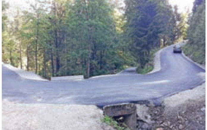
Prenova ceste Murave–Žetina je končana.

Lani so potekala večja vzdrževalna dela oziroma obnove na cestnih odsekih: Suša–Dolenja Žetina, odcep Kolavž, in Gorenja Žetina–Dolenja Žetina. Ti odseki ležijo na skoraj tisoč metrih nadmorske višine, tu pa zima malo prej pokaže zobe. Tega žal izvajalec asfaltiranja ni upošteval, zato bodo ti odseki lahko dobili asfaltno prevleko šele letos. Obnovljen je bil most na lokalni poti Dolenčice–Zakobiljek. Izvedli so tudi sanacijo udara na cesti Četena Ravan–Zapreval, oporni zid na cesti v vasi Mlaka,