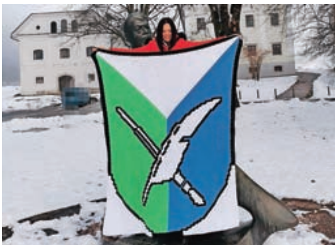
Lidija Novak z nakvačkanim grbom

Lidija Novak se je za kvačkanje navdušila leta 2019 v želji, da bi tako izdelala kak uporaben predmet. Najprej so nastali trakovi in kape, kasneje se je lotila tudi oblačil in igrač. "Osebnost mi je najlepša, ko nekomu podariš nekaj, kar si ustvaril sam, s svojimi rokami." S kvačkanjem grba velikosti 135 krat 165 cm je 211 kvačkaric in en kvačkar začelo sredi septembra. Za izdelavo grba je porabila več kot sto ur, a se med samo izdelavo