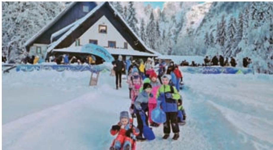
Zimska pravljica v Tamarju