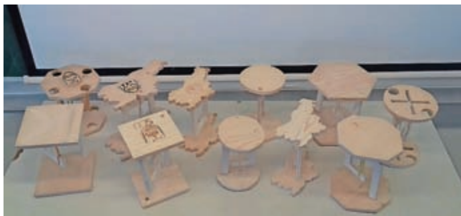
Lebdeče mizice – izdelki učencev na tekmovanju Krošnja idej