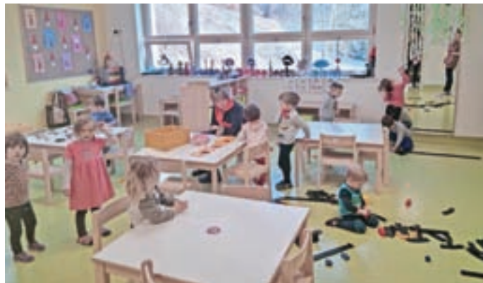
V začetku januarja so se otroci in zaposleni v Vrtcu Agata preselili v nove prostore.