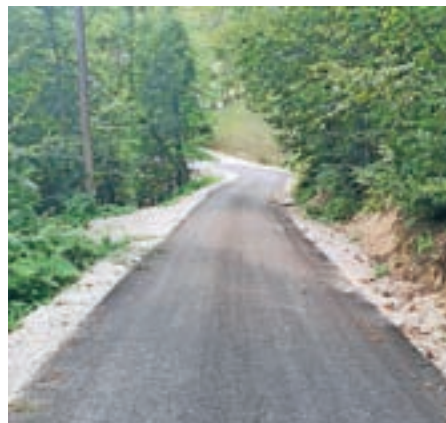
Lani smo asfaltirali odsek ceste Hobovše–Travnik.

Na avtobusnem postajališču Fužine smo postavili novo hiško, v kateri lahko potniki počakajo na avtobus, zamenjali smo tudi del dotrajane ograje na mostu skozi Fužine, z novo ograjo v brežini pa sta opremljeni dve javni poti, in sicer Svislarjeva grapa in Kladje, obe v dolžini