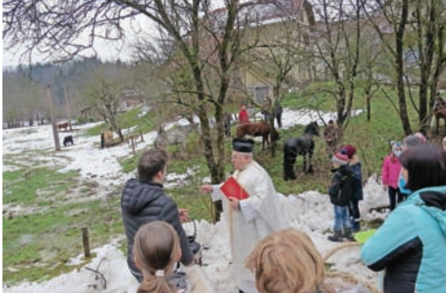
Konji so na štefanovo na Hotavljah prejeli blagoslov.

Tudi lani so hotaveljski konjeniki, ki delujejo v okviru Turističnega društva Hotavlje, pripravili srečanje na god njihovega zavetnika ob hotaveljski cerkvi, seveda v skladu z aktualnimi epidemiološkimi omejitvami, ter se mu priporočili za zdravje svojih živali. Prišlo je devet konj, ki jih je po končani nedeljski