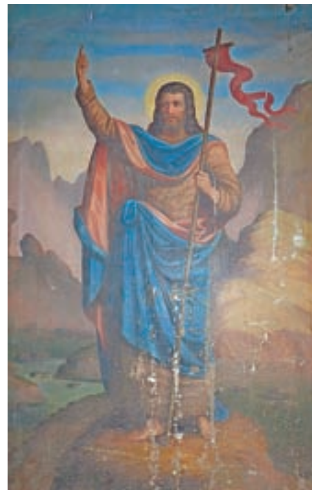
Slika pred restavratorskim posegom. Spodnji del je bil močno poškodovan in delno uničen.

Janez Wolf je bil rojen leta 1825 v Leskovcu pri Krškem kot nezakonski otrok z materinim priimkom Pajer, priimek Wolf je po očetu povzel kasneje. Umrli je v Ljubljani v 60. letu starosti, leta 1884. Že mlad je pokazal nadarjenost za risanje, zato je iskal priložnosti za likovno izpopolnjevanje in izobraževanje. Po nekajletni vojaški službi se je popolnoma posvetil umetnosti. Wolf je večino svojega likovnega udejstvovanja posvetil sakralnim vsebinam in ustvaril številna dela, v glavnem gre za stensko slikarstvo in slike na platnu za cerkve po vsej Sloveniji. Med njegova najbolj znana dela sodijo freske v župnijskih cerkvah na Vrhniki in v Vipavi. Njegovi učenci so bili poljanski rojaki Anton Ažbe iz Dolencic ter Janez in Jurij Šubic iz Poljan. Wolfov vpliv je bil velik in večstranski. Položil je temelje historično usmerjeni poznonazarenski umetnosti druge polovice 19. stoletja, s svojim delom in vzgojo pa neposredno vplival na razvoj slovenskega slikarstva v smeri realizma, ki sta ga nadaljevala že omenjena brata