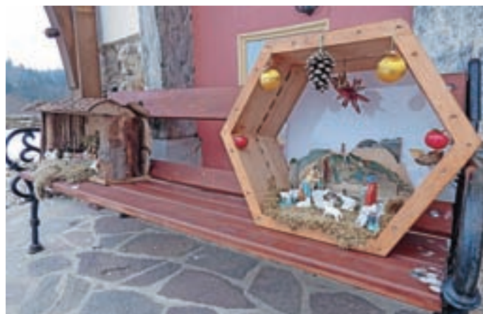
Jaslice pri cerkvi sv. Križa