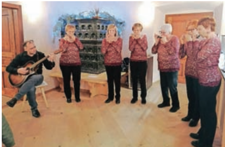
Za zaključek leta smo povabili še Loške orglice.