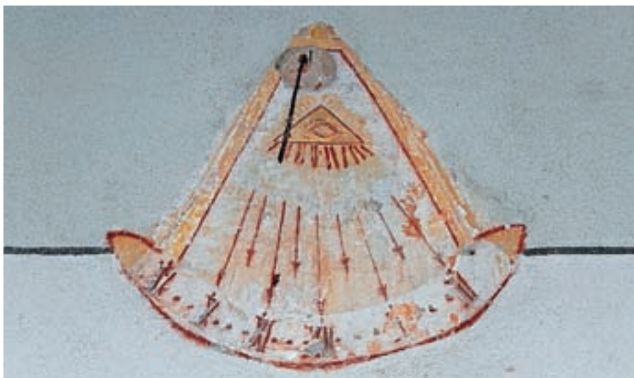
Sončna ura je bila ena najstarejših na Poljanskem, kazala pa je le določene ure dneva.