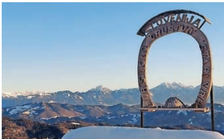
Pod Starim vrhom so pripravljene na novo pohodno sezono.

Ti trije pohodi potekajo po že znanih trasah. Preostale štiri pa so preimenovali v "sezonske" pohode: Zimski pohod, Pomladni pohod, Poletni pohod na Blegoš in Jesenski pohod. Tu bodo, razen