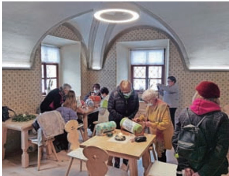
Druženje s članicami gorenjevaškega klekljarskega društva Deteljica