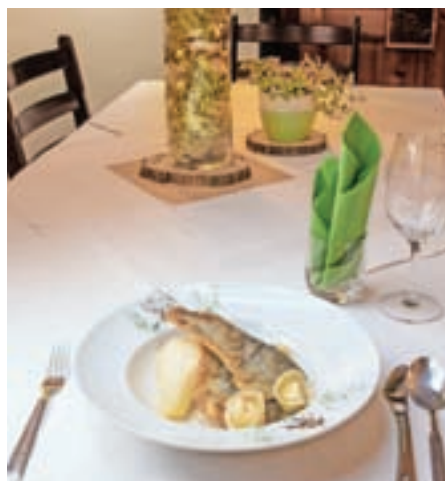
Festivalska jed Gostilne Lipan: postrv z mavravohovo omako in hruško, kuhano v vinu

V okviru kulinarčnega festivala Okusi Škofjeloškega so na podlagi predhodnih rezervacij sodelujoči gostinci goste razvajali z unikatnimi meniji, ki jih je navdihnila lokalna tradicija. V Lipanu so za kulinarčni festival pripravili lahek obrok, ki je bil primeren tako za kosilo kot večerjo. Za predjed so postregli juho z drobnjakovimi štruklji, za glavno jed je bilo mogoče uživati ob postrvi z mavravohovo omako in hruško, kuhano v vinu, vse skupaj pa je zaokročila hišna sladica. Lokalni dobavitelji surovin festivalskega